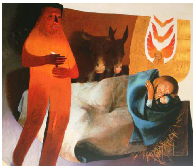
Naissance à Bethléem - Arcabas